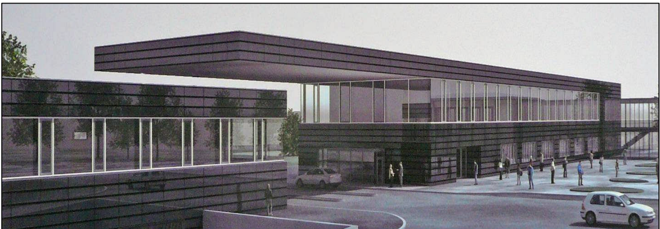
Bild 1: Visualisierung des neuen Eingangsgebäudes (HENN-Architekten Berlin)

Im Rahmen der Umgestaltung und des Ausbaus des Forschungszentrums Dresden-Rossendorf (FZD) wurde die Umstrukturierung und der Neubau des Eingangsbereichs geplant. Der Entwurf des neuen, repräsentativen Eingangs- und Logistikgebäudes des Architekturbüros Henn wird geprägt durch die filigrane, 22 m auskragende Vordachkonstruktion.